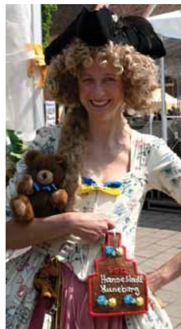
Hanse tag 2012 Flyer III - Lüneburg - August 2011 - epos-design - Fotos: Joachim Scheunemann und Erhard Polzin