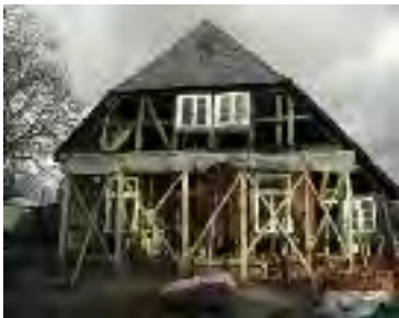
Ehemaliges Pfarrwitwenhaus Anfang 19. Jh. Gemeinde Neuhaus-Stapel Sanierung/Instandsetzung des Fachwerks

Der Landkreis Lüneburg bietet über die sogenannte Denkmalbörse interessierten Bauherrn die Vermittlung von historischen Baustoffen an. Diese können dann bei einer Sanierung des Baudenkmals zum Einsatz kommen und dem Erhalt des historischen Gestaltbildes sowie der Ressourcenschonung dienen.