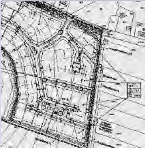
Kirchgellersen Bebauungsplan Nr. 12 "Am Steinbint" Planung: Meyer ARC + Partner

Als Bauinteressent/in sollten Sie sich – möglichst mit Hilfe einer geeigneten Entwurfsverfasserin / eines geeigneten Entwurfsverfassers – vorab bei der Gemeinde über den Inhalt des Bebauungsplanes und ggf. weitere Satzungen informieren, um Ihre Planung darauf abzustimmen.