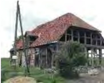
Scheune der ehemaligen Deichvogtei von 1802 Gemeinde Neuhaus-Brandstade Sanierung/Instandsetzung des Fachwerks

Jede bauliche Veränderung oder Nutzungsänderung eines Baudenkmals ist genehmigungspflichtig. Daher sollten Sie beabsichtigte Baumaßnahmen frühzeitig mit uns als unterer Denkmalschutzbehörde abstimmen – auch aus finanziellen Erwägungen –, denn nur für Maßnahmen, die vorab mit der Denkmalschutzbehörde abgestimmt und von ihr genehmigt worden sind, können Sie als Denkmaleigentümer eine steuerliche Abschreibung bzw. Förderung oder eine Zuwendung aus Landesmitteln in Anspruch nehmen.