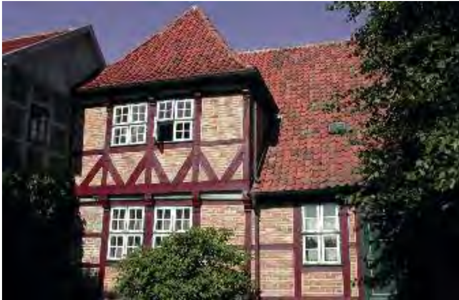
Amt Neuhaus Parkstraße 1

Die Anforderungen des Bauordnungsrechts sind der Niedersächsischen Bauordnung (NBauO), den ergänzenden Gesetzen und Verordnungen und den Technischen Baubestimmungen zu entnehmen. Die NBauO begründet Pflichten und Ansprüche des Einzelnen im Verhältnis zum Gemeinwesen und lässt die Verwaltungsbehörden mit hoheitlichen Mitteln für die Erfüllung dieser Pflichten und Ansprüche sorgen.