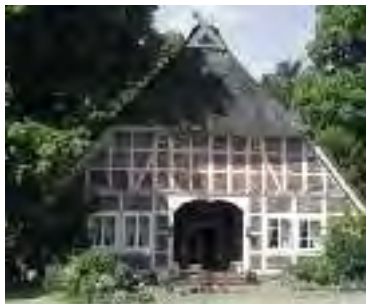
Wirtschaftsgebäude Mitte 19. Jahrhundert Gemeinde Rehlingen