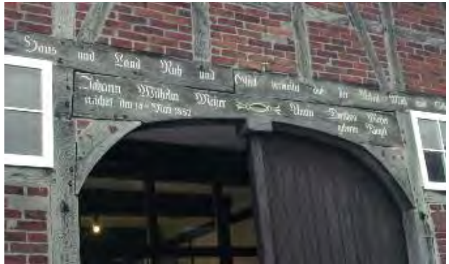
Inschriftbalken über der GrotDör