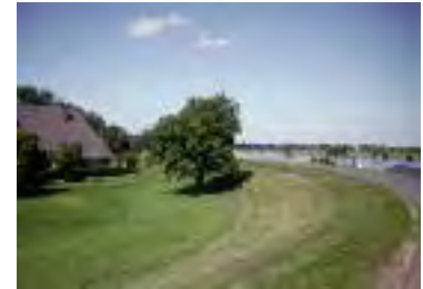
Elbedeich bei Radegast, Landkreis Lüneburg

Generell gilt beim Bauen hinter dem Deich, dass insbesondere bei Hochwasser hohe Grundwasserstände auftreten. Dieses ist bei Gründungsarbeiten und der Errichtung von Kellerräumen unbedingt zu berücksichtigen.