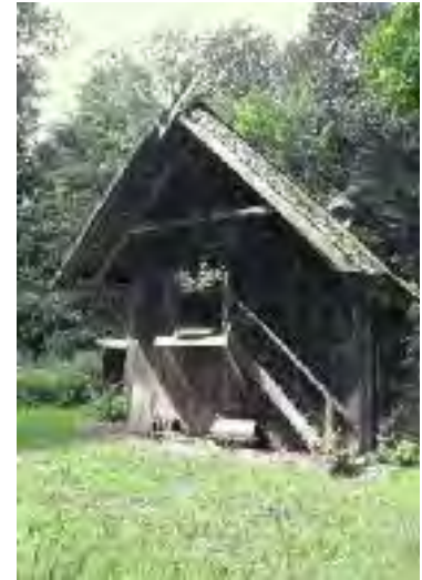
Treppenspeicher von 1767 Gemeinde Betzendorf