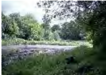
Klein Sommerbeck Renaturierter Fischteich