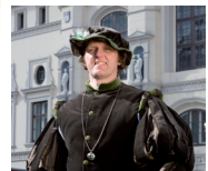
Sulfmeister 2007 – Cord I.