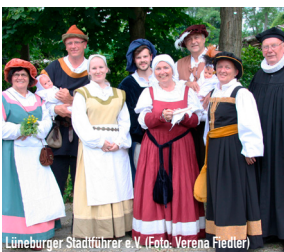
Lüneburger Stadtführer e.V.