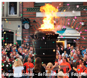
Kronen der Abschluss – die Fassverbrennung