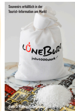
Souvenirs erhältlich in der Tourist-Information am Markt

Ob Groß oder Klein, Jung oder Alt - bei uns finden Sie das richtige Mitbringsel für Ihre Freunde oder ein kleines Andenken an Ihren Aufenthalt bei uns. Wir freuen uns auf Ihren Besuch in der Tourist-Information im Rathaus am Markt.