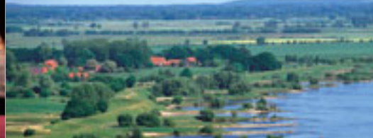
Valle del fiume Elba

L' ufficio è aperto tutto l'anno lun - ven dalle ore 9:00 alle 18:00 mag - ott sab - dom dalle ore 9:00 alle 16:00 nov - apr sab dalle ore 9:00 alle 14:00