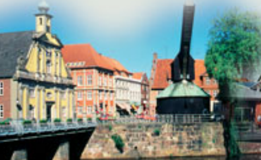
Il Centro d'acquisto e l'antica gru