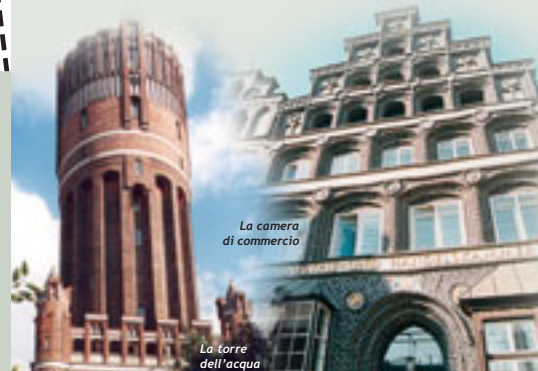
La camera di commercio

La chiesa di St. Michaelis fu costruita tra il 1376 - 1418 insieme al monastero, ai piedi del Kalkberg all'interno della città. La caratteristica più interessante della chiesa è la particolare conformazione del suolo, dovuta agli sprofondamenti determinati dai sottostanti depositi salini, come si può vedere dalla pendenza delle colonne interne. E' interessante ricordare che uno dei componenti del coro della scuola del monastero di St. Michaelis tra 1700 e il 1702 fu Johann Sebastian Bach.