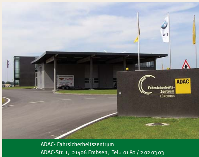
ADAC- Fahrsicherheitszentrum ADAC-Str. 1, 21406 Embsen, Tel.: 01 80 / 2 02 03 03

Weitere Informationen zu den Sehenswürdigkeiten und vielen Ausflugszielen erhalten Sie im Internet unter: www.samtgemeinde-ilmenu.de